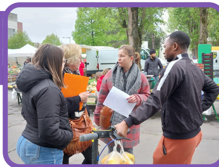
Session de recensement des besoins, marché de la Haute Folie, Hérouville Saint-Clair